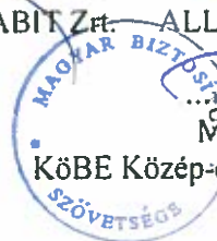
MABISZ VKB vezető.